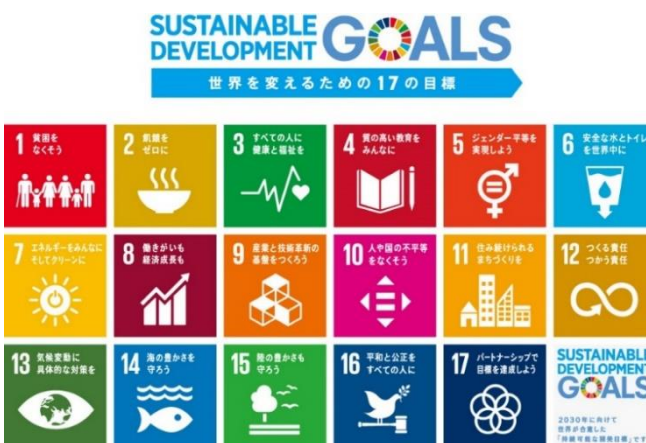
参考資料：国際連合広報センター「ロゴ(日本語版)」

SDGsは、Sustainable Development Goalsの略で、2015年の国連サミットにおいて持続可能な開発目標として採択されたものです。広範な分野にわたって、2030年までに達成を目指す17の開発目標が設定されています。その宣言文の導入部では、SDGsの大切な理念として「誰一人取り残さない」と謳っています。誰もが暮らしやすい社会を実現することがこれからの時代を生きる私たちにとって重要なテーマとなっています。