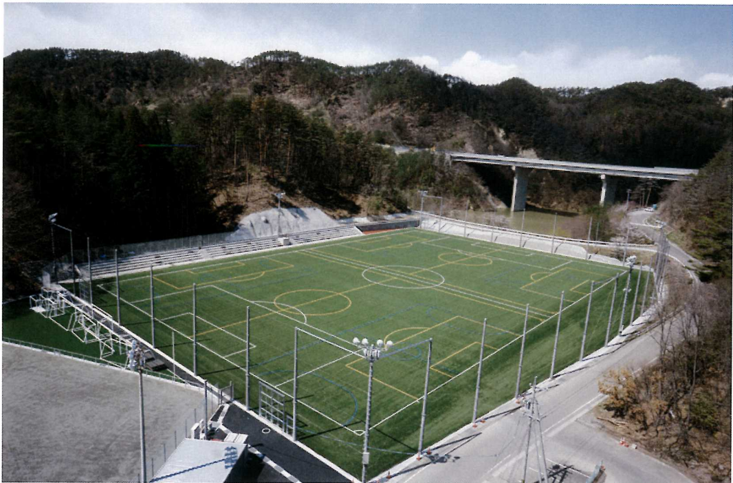
筑北村特定地区公園（サッカー場） 平成29年3月 竣工