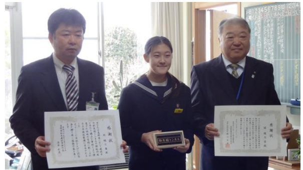
筑北村側銘鋌…レプリカ (花岡大雅さん揮毫)