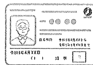
調査員が身に付けている 「調査員証」(見本)